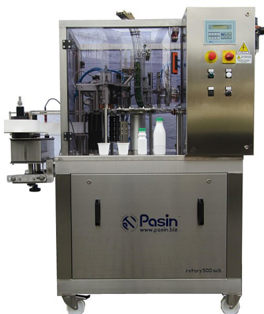
FOTO: ROTARY 500 SCB full optional

CONFEZIONATRICE SEMIAUTOMATICA MULTIVALENTE PER LATTE E YOGURT IN BOTTIGLIE DI PET CON TAPPO A VITE E VASETTI CON COPERCHIO TERMOSALDATO